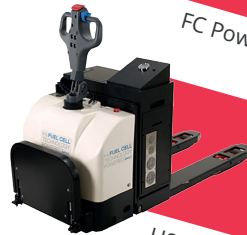
H2 Pallet truck