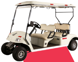
H2 Golf cart