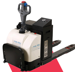
H2 Pallet truck