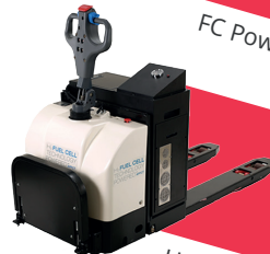
H2 Pallet truck