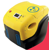
FC Power Generator