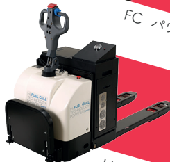
H2 パレットトラック