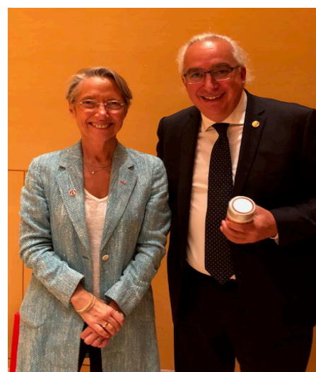
Stéphane Aver aux côtés de madame la ministre chargée des Transports, Élisabeth Borne

et aux côtés de Madame la Ministre chargée des Transports Elisabeth Borne, ambitionne de faire de STOR-H un standard technologique national pour la mobilité verte légère hydrogène.