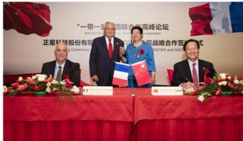
▲正星科技股份有限公司与AAQIUS公司签约，拉法兰先生与顾秀莲女士见证

”从官方到民间，“一带一路”倡议焕发出了强大的感召力，正星科技股份有限公司与法国AAQIUS公司的此次战略合作签约正是响应国家“一带一路”倡议的表现，此为起点，相信在双方的共同努力下，必将在合作共赢的大舞台上绽放光彩。