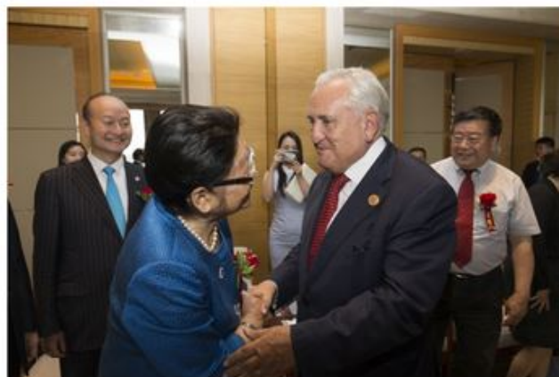
▲法国总统特使拉法兰先生与十届全国人大副委员长顾秀莲女士愉快会晤

主席让-皮埃尔·拉法兰先生携同法国代表团团员，参加了响应“一带一路”倡议的中法能源企业间的战略合作签约仪式——正星科技股份有限公司和AAQIUS公司战略合作签约仪式。中方亦邀请十届全国人大副委员长、中华环保联合会名誉主席顾秀莲女士到场与拉法兰先生共同见证此次中法合作。